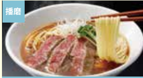
播磨 揖保乃糸「手延中華麺」龍の夢 神戸牛醤油ラーメン はりま製麺株式会社