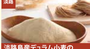
淡路 淡路島産デュラム小麦の セモリナ粉 淡路麺業株式会社