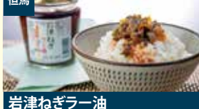
但馬 岩津ねぎラー油 株式会社グリーンウインド