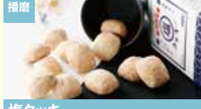
播磨 塩クッキー 播州海運合資会社(赤穂のお菓子プリエール)