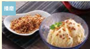
播磨 有機 焙煎玄米α エムズ