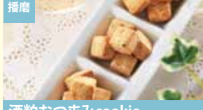
播磨 酒粕おつまみcookie (うま塩、京七味、柚子胡椒) 田園Sweetsアンジェリーナ