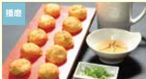
播磨 つけだし汁付き あかし玉子焼の粉セット 株式会社夢工房