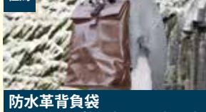
但馬 防水革背負袋 Waterproof leather Backpack D.L.P.