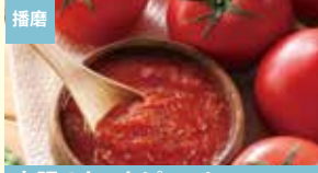
播磨 太陽のトマトビュレ 岡田農産株式会社