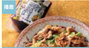
播磨 豚肉と旬野菜でつくる 味噌炒めの素 有限会社小松屋