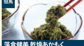
但馬 藻食健美 乾燥あかもく 特定非営利活動法人たけのかぞく