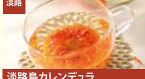
淡路 淡路島カレンデュラ 廣田農園(廣田久美)