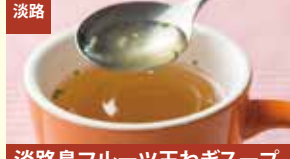
淡路 淡路島フルーツ玉ねぎスープ お徳用30食入 株式会社善太