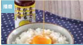
播磨 たまごにかけるぼん酢 メイジョーソース株式会社