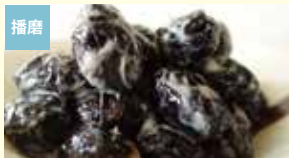
播磨 丹波黒納豆 有限会社松井食品