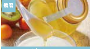
播磨 Hani2のはちみつ Hani2