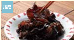
播磨 根日女いくらげ佃煮(黒) 株式会社根日女グリーンファーム