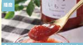
播磨 「八百ちゃんいちご」を使用した オールフルーツジャム(いちご) 株式会社みつヴィレッジ