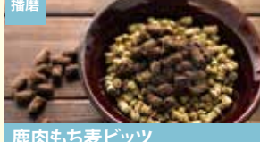
播磨 鹿肉もち麦ピッツ 株式会社一 (ONESMILE)