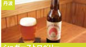
丹波 シュガーストロベリー 丹波路ブルワリー