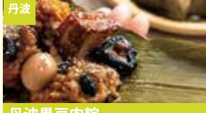
丹波 丹波黒豆肉粽 おくも丹波黒豆肉粽(株式会社ナカタニ)