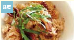
播磨 明石蛸のたこ飯の素 株式会社神戸グルメ