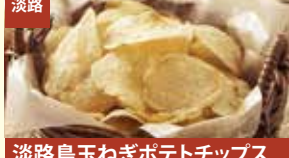
淡路 淡路島玉ねぎポテトチップス 株式会社鳴門千鳥本舗