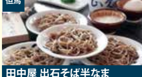
但馬 田中屋 出石そば半なま 4人前 緑箱つゆ付 株式会社田中屋食品