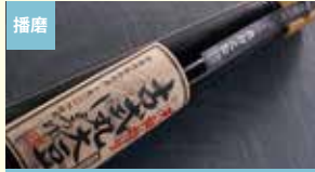
播磨 古式丸大豆しょうゆ 高橋醤油株式会社