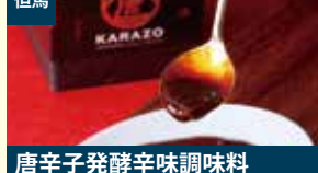
但馬 唐辛子発酵辛味調味料 「唐三」原液 黒ラベル 株式会社奥但馬