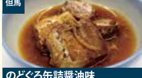
但馬 のどぐろ缶詰醤油味 株式会社ハマダセイ