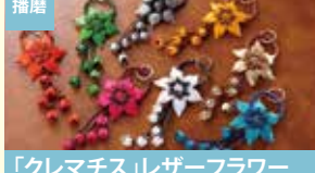
播磨 「クレマチス」レザーフラワー チャーム 雅彦化成株式会社