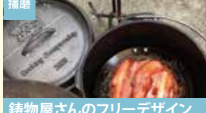
播磨 鋳物屋さんのフリーデザイン ダッチオープン 有限会社下川鋳造所