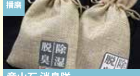
播磨 竜山石 消臭隊 株式会社ケーブラン