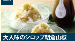
但馬 大人味のシロップ朝倉山椒 やぶパートナーズ株式会社