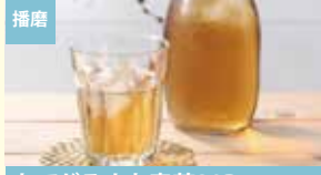
播磨 おてがるもち麦茶20P (マイボトル用) 株式会社寺尾製粉所