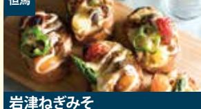
但馬 岩津ねぎみそ 株式会社NOUEN