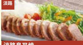
淡路 淡路島又焼 Awajishima BBQ pork たねざん 釜焼きチャーシューと中国茶