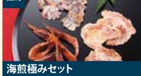
但馬 海煎極みセット 香すみ堂株式会社