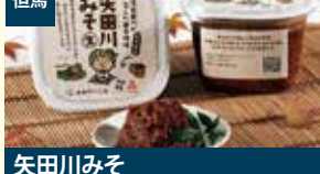
但馬 矢田川みそ むらおか夢アグリ株式会社