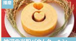
播磨 神河の米粉baumkuchen アグリノベーション神河株式会社