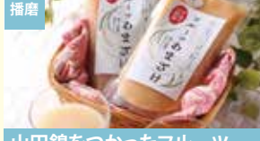
播磨 山田錦をつかったフルーツ 甘酒セット 株式会社AddVenture