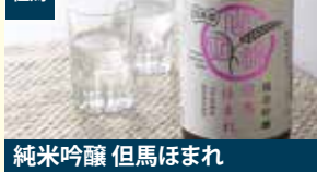
但馬 純米吟醸 但馬はまれ 株式会社Amnak