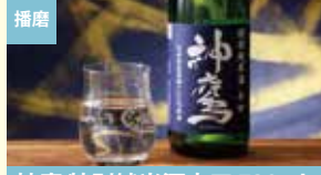
播磨 神鷹 特別純米酒辛口 720ml 江井ヶ嶋酒造株式会社