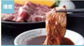
播磨 焼肉のたれ 兵庫自慢 主原料にこだわった旨味 ぶっちゃー株式会社