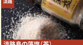
淡路 淡路島の藻塩(茶) PREMIUM卓上用45g 株式会社多田フィロソフィ