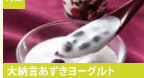
丹波 大納言あずきヨーグルト 丹波乳業株式会社