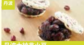
丹波 丹波大納言小豆 手づくりもなか 宮東農園